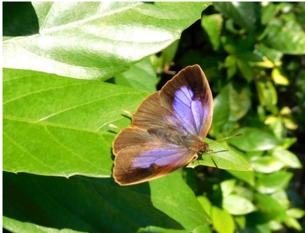
川崎市ハイム 11月6日 (2016年) アラカシの葉上