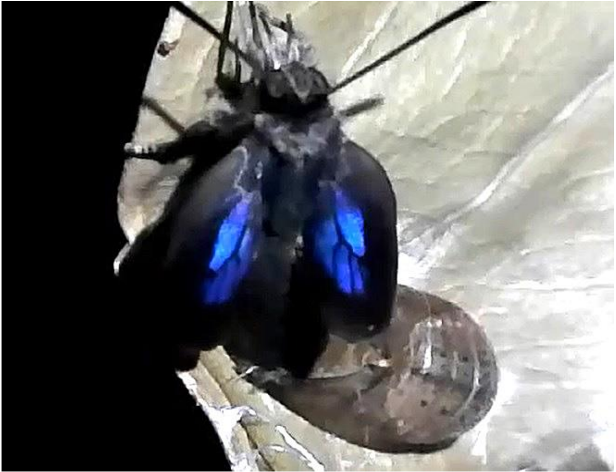
川崎市 9月24日（2024年） 中野島 羽化 ♀