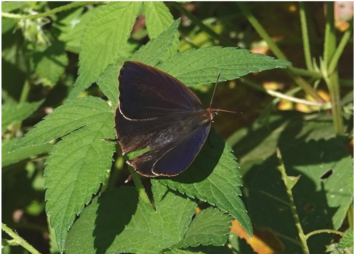
川崎市 10月21日（2024年） 多摩川 中野島 ♂