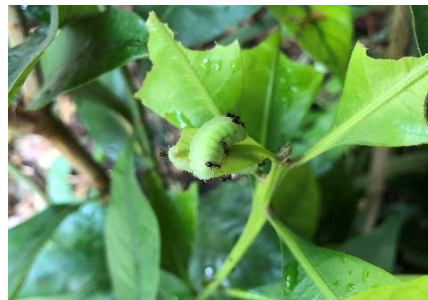
← 川崎市 10月4日 (2019年) マテバシイの若葉を食す終齢幼虫。甘い分泌液を出してアリを待らして、ガードマンとして使っている。ムラサキシジミと同様