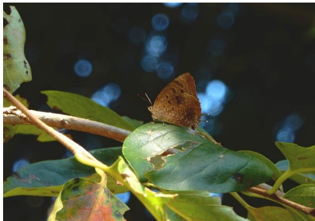
川崎市 10月7日 (2018年)