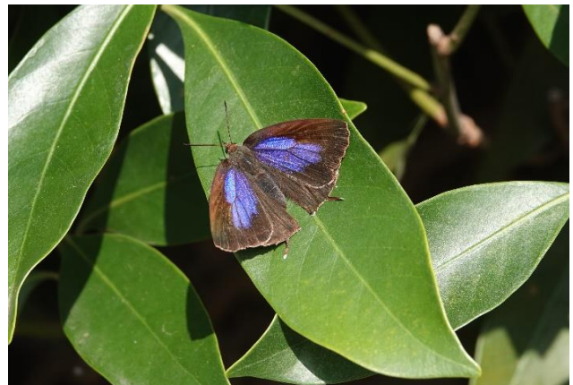
川崎市 10月29日 (2021年) 食樹マテバシイの葉上