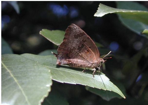
川崎市 9月18日 (2005年)