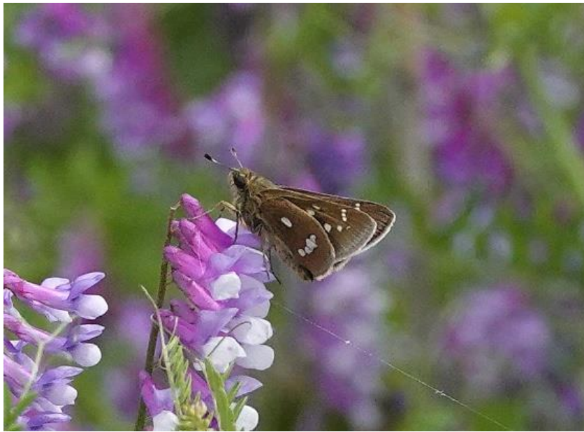
川崎市 4月29日（2024年） ナヨクサフジ