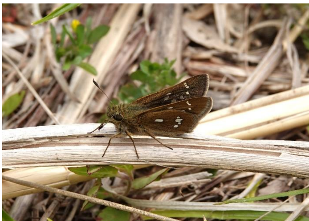
川崎市 4月17日(2022年) ミヤマチャバネセセリ 後羽の中央の白紋が大きく目立つ