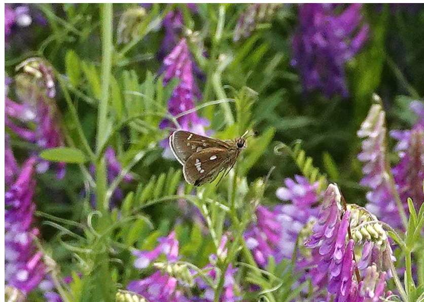
川崎市 4月29日（2024年） 飛翔