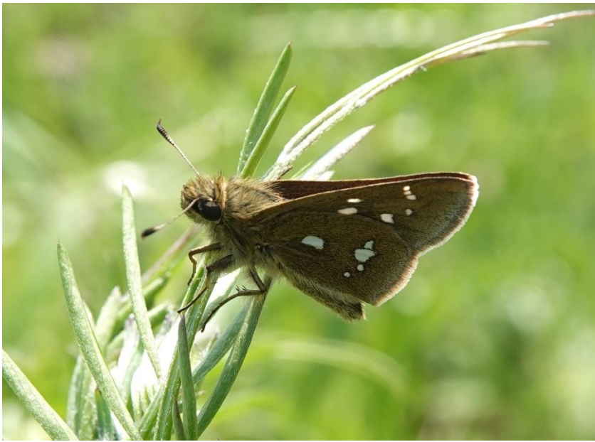
川崎市 4月20日（2023年） 新鮮な個体