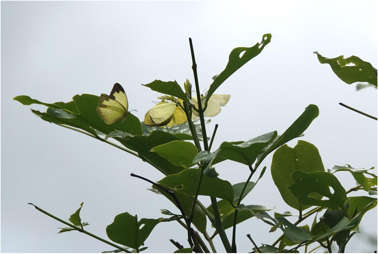
石垣島 10月12日（2020年） 近縁の台湾キチョウ 食樹アカハダで産卵中