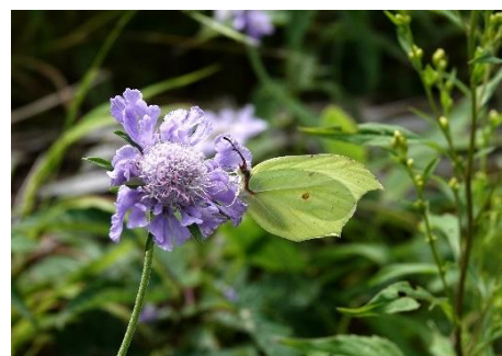
スジボンヤマキチョウ 長野県南佐久郡