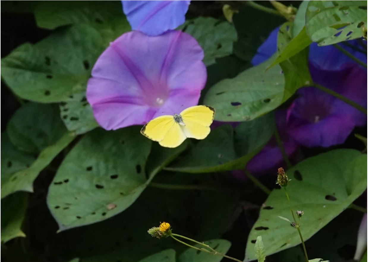
キタキチョウ 川崎市 11月2日（2021年） 多摩川土手のノアサガオに飛来する