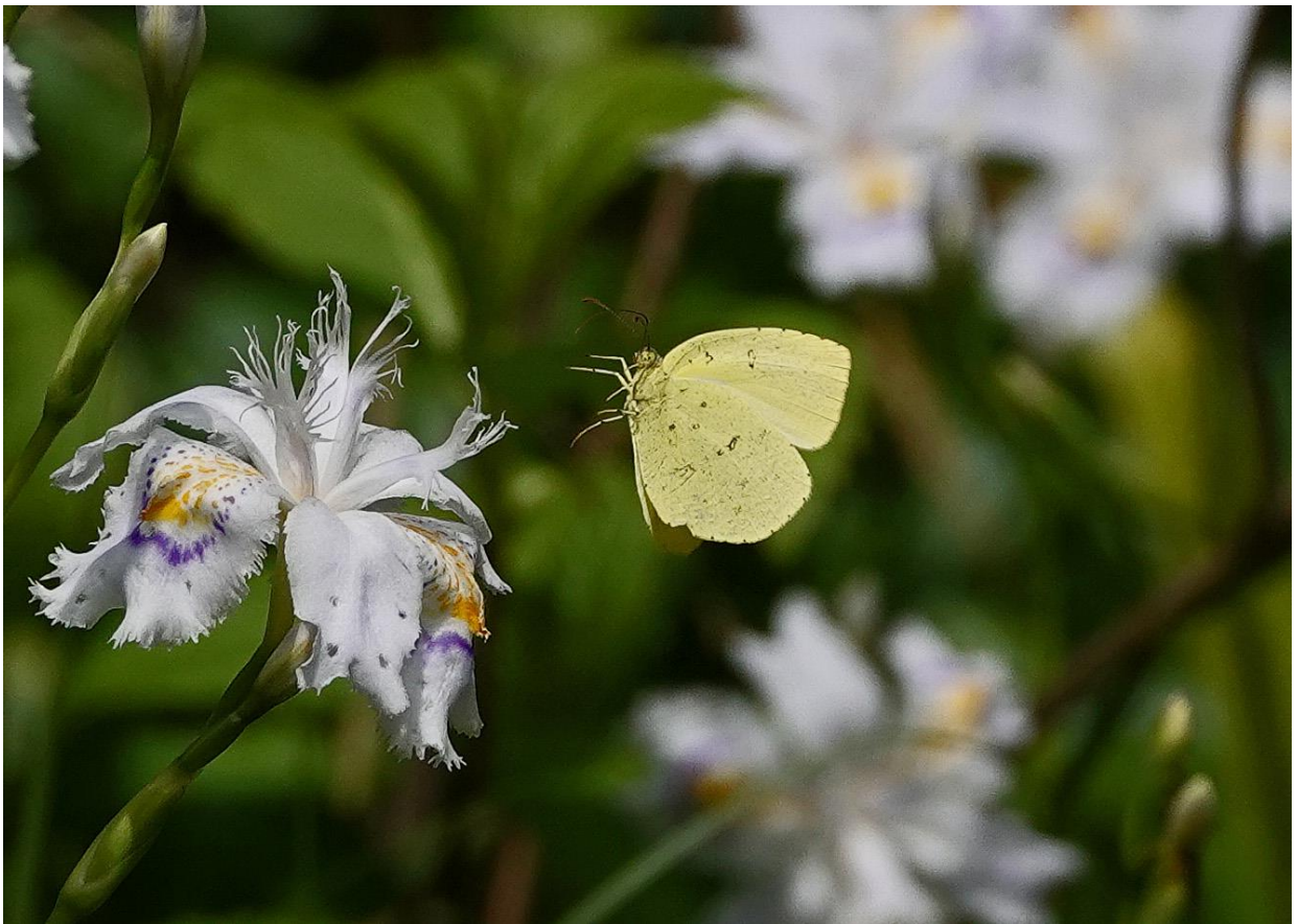
キタキチョウ 川崎市 4月7日（2024年） 緑地のシャガに飛来する