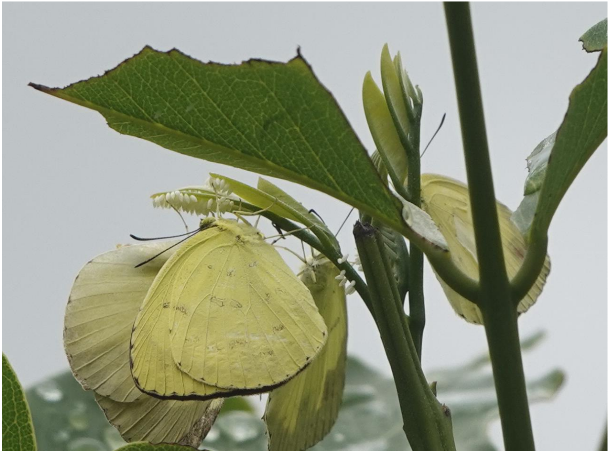
石垣島 10月12日（2020年） 近縁の台湾キチョウ 食樹アカハダで産卵 卵の数！