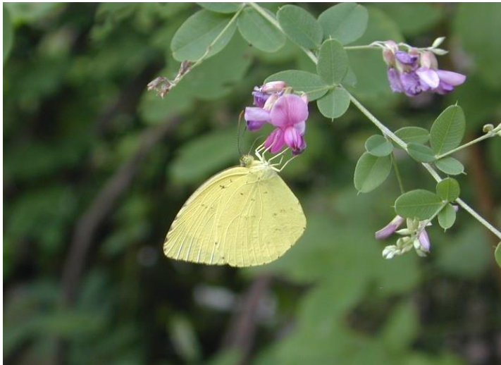
川崎市 8月6日(2011年)ハギで吸蜜