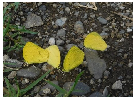
多摩川土手(稲田堤) 9月12日(2019年) 吸水

ハイムでもよく見かける黄色い蝶です。とまと必ず羽を閉じるので、裏よりも格段に美しくはっきりとした表羽の黄色は飛んでいるときにしか確認できないのは残念です。訪花するだけでなく、地面で吸水もしますがすぐに居るのがわかるほど目立つ蝶です。ほかに黄色い蝶としては、キタキチョウによく似たツマグロキチョウ(前羽が尖っているところが違いますが、急激に減少し周辺で見たことはありませんし県内からも消えたとの情報もあります)、また、このあたりでは見られませんが、山地性でキタキチョウより大型のヤマキチョウ、スジボンヤマキチョウがあげられます。