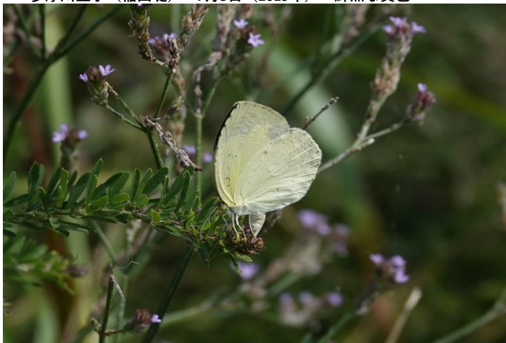
多摩川土手(稲田堤) 9月22日(2019年)メドハギに産卵する♀ 紫花はアレチハナガサでメドハギではない

ハイムでもよく見かける黄色い蝶です。とまと必ず羽を閉じるので、裏よりも格段に美しくはっきりとした表羽の黄色は飛んでいるときにしか確認できないのは残念です。訪花するだけでなく、地面で吸水もしますがすぐに居るのがわかるほど目立つ蝶です。ほかに黄色い蝶としては、キタキチョウによく似たツマグロキチョウ(前羽が尖っているところが違いますが、急激に減少し周辺で見たことはありませんし県内からも消えたとの情報もあります)、また、このあたりでは見られませんが、山地性でキタキチョウより大型のヤマキチョウ、スジボンヤマキチョウがあげられます。