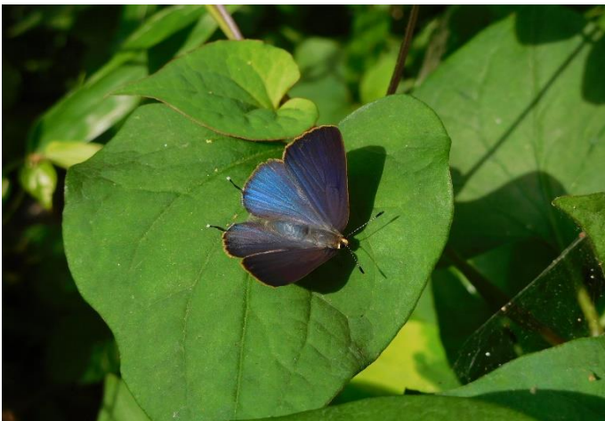
川崎市 6月11日 (2017年) ドクダミの咲き誇る斜面