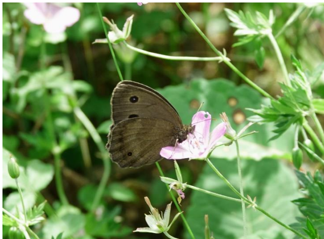
長野県諏訪郡 8月12日 (2019年) ハクサンフウロで吸蜜