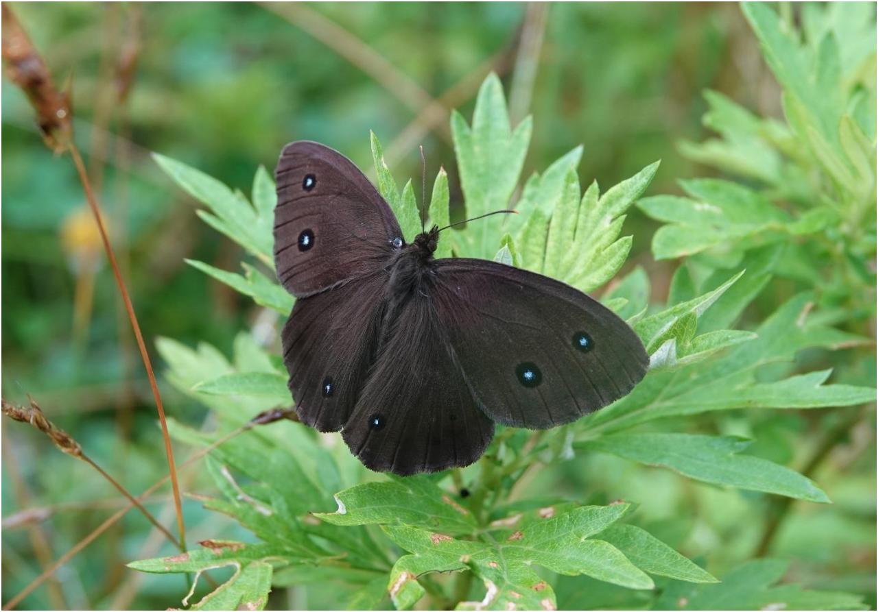
長野県南佐久郡 7月27日（2020年） 早朝（6時14分）の下草にとまり開翅。蛇の目が印象的