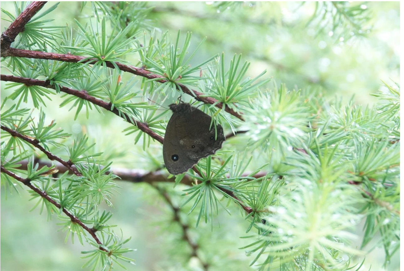
長野県南佐久郡 7月28日（2020年） 雨宿り