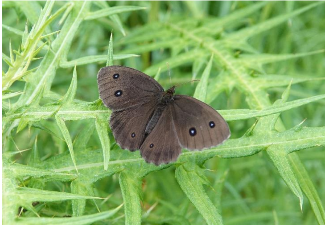
長野県南佐久郡 7月24日 (2019年) アザミの葉上で開張