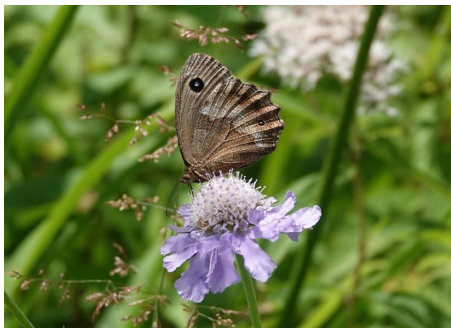
長野県諏訪郡 8月12日 (2019年) マツムシソウで吸蜜