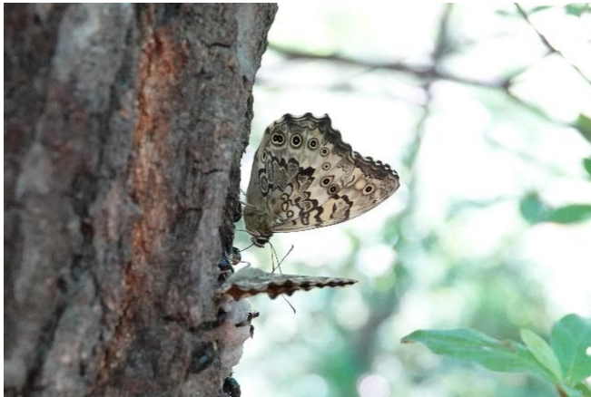
川崎市 5月26日(2019年) コナラ樹液に集まる