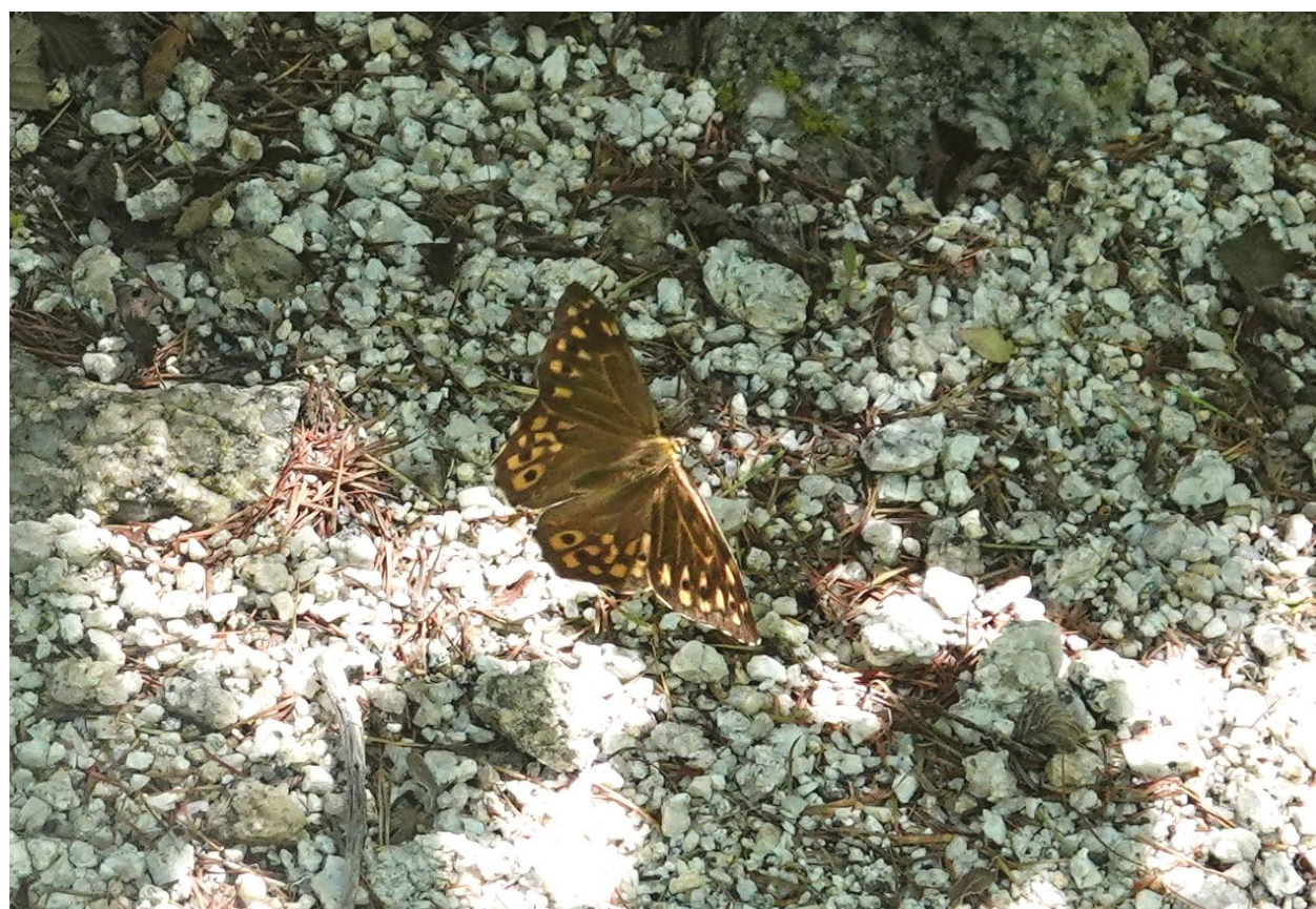
ヤマキマダラヒカゲ 長野県 梓川左岸 7月20日 (2021年) 飛翔