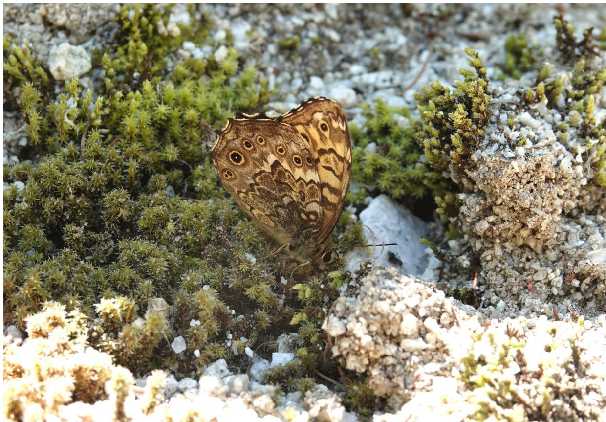
ヤマキマダラヒカゲ 長野県 梓川左岸 7月19日 (2021年) サトキマダラヒカゲとは微妙な違い