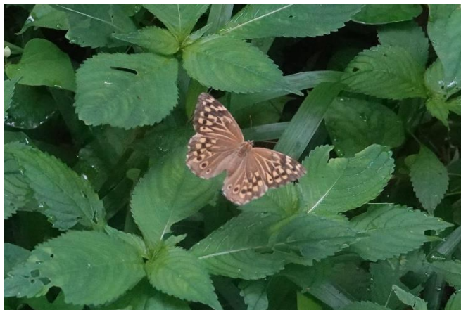
川崎市 6月6日(2020年) 湿地上を飛翔。とまっている時は、翅は閉じたままなので飛んでいる時しか表は見えない