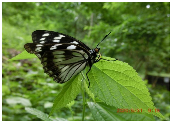
川崎市 5月31日 (2020年) 羽化したてらしい