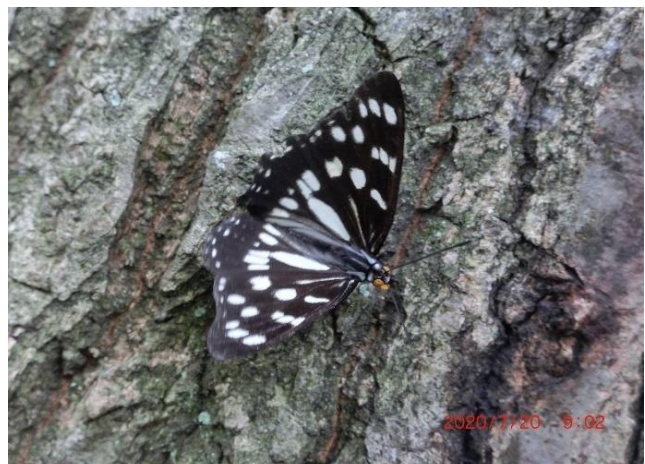
川崎市 7月20日 (2020年) 樹液を吸う