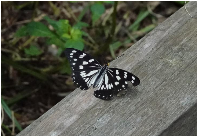
川崎市 9月13日 (2022年) 緑地の栈道の手摺にとまる