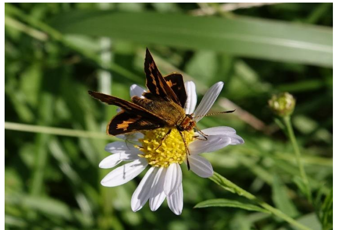
多摩川土手 (久地) 10月11日 (2022年) カントウヨメナで吸蜜