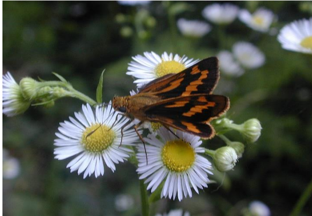
川崎市 6月24日 (2006年) ヒメジョオンで吸蜜

イチモンジセセリと並んでこのあたりでよく見かけるセセリチョウです。黄色と黒の段だら模様の羽に特徴があるので見分けるのは簡単です。よく似た種類として、ヒメキマダラセセリ (森林性)、コキマダラセセリ (本州では山地性、北海道では平地) がいますが、いずれもこのあたりでは見られず少し遠足しなければ見られません。