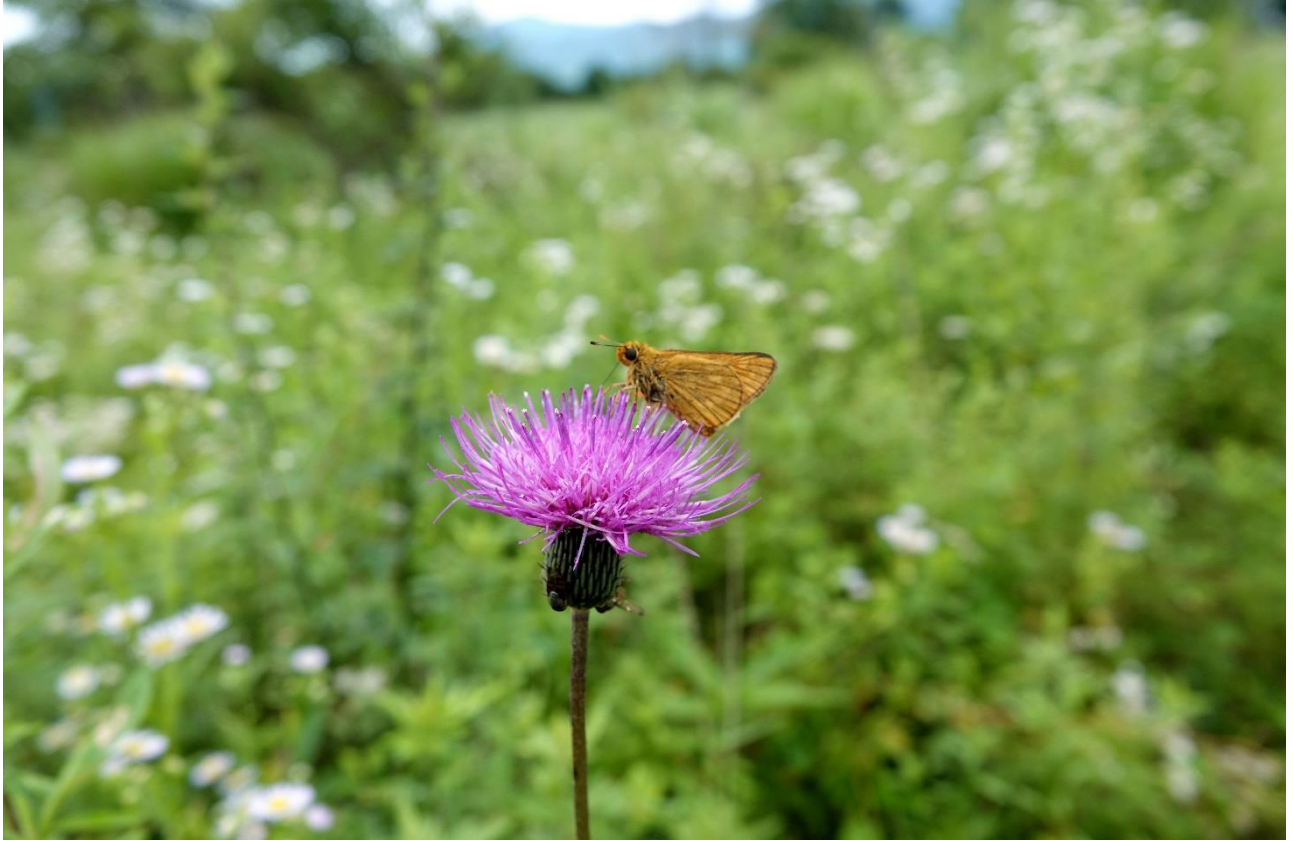
コキマダラセセリ 長野県南佐久郡 7月27日（2020年） ミヤコアザミで吸蜜