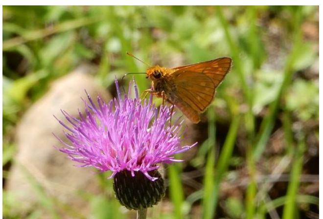
コキマダラセセリ 長野県南佐久郡 7月26日 (2015年) ミヤコアザミで吸蜜