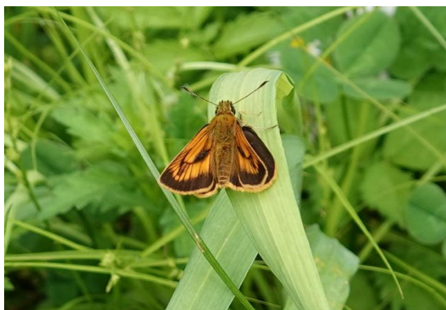
ヒメキマダラセセリ 八王子市 5月24日 (2020年)