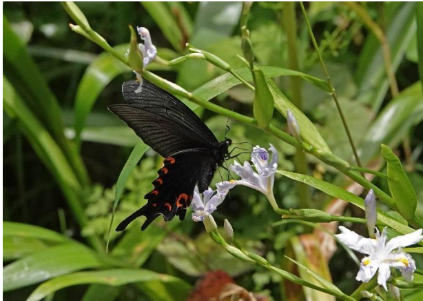
八王子市 5月3日(2023年) シャガで吸蜜