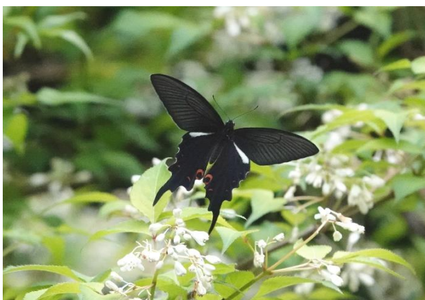
八王子市 5月8日(2022年) ヒメウツギに飛来