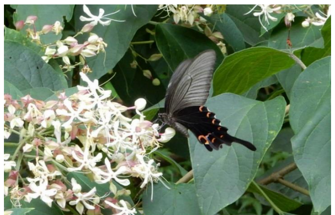
川崎市 8月8日(2015年) クサギで吸蜜