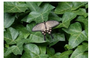
ジャコウアゲハ ♀ ハイム 9月1日(2019年)

名前からも写真からも尾(尾状突起)が長いのがわかります。ハイム周辺や多摩川では見かけませんが生田緑地では個体数も多いアゲハチョウです。